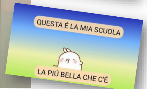
QUESTA É LA MIA SCUOLA