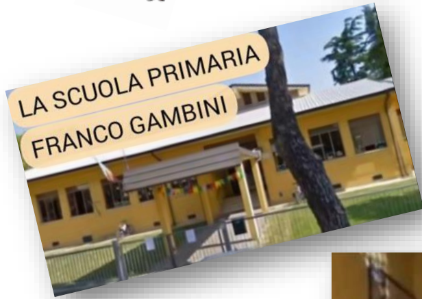
LA SCUOLA PRIMARIA FRANCO GAMBINI

VI ASPETTIAMO A CALISESE IN VIA CAPRANICA, 223