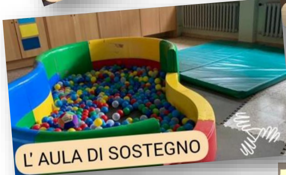
L'AULA DI SOSTEGNO